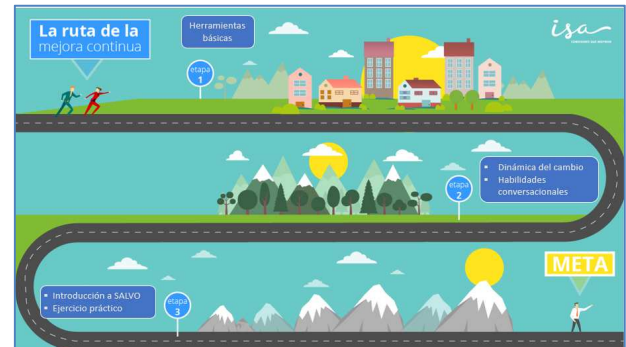
gráfico 4: Ruta de aprendizaje gestores de mejoramiento

Para el aseguramiento de que los gestores de mejoramiento cumplan su rol, se inició la estrategia de desarrollarlos, es por esto que se elaboró una ruta de aprendizaje (gráfico 3), en la cual se definió las herramientas y metodologías que cada gestor de mejoramiento debe aprender para ejercer su rol y replicarlas dentro de sus equipos de procesos.