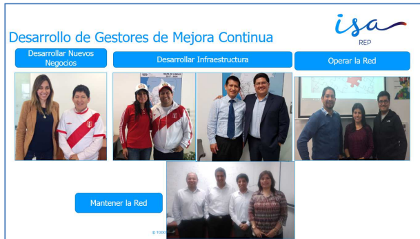
foto 1: Gestores de mejoramiento del ciclo de vida seleccionados

importante y transformador que es su rol. (Ver: foto 1)