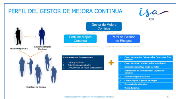
gráfico 3: Perfil de gestores de mejoramiento

Con estas funciones, se definió el perfil del gestor de mejoramiento, las competencias y habilidades que requiere el rol para su efectivo ejercicio del rol (Ver: gráfico 3)