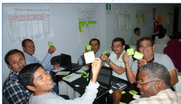
Foto4: mentes brillantes en Departamento de Transmisión norte