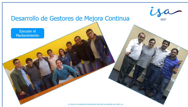
foto 2: Gestores de mejoramiento del ciclo de vida seleccionados - mantener