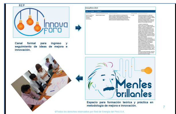
gráfico 5: Innovaforo y mentes brillantes

Los primeros mecanismos fueron: el INNOVAFORO – para incentivar la generación de ideas de mejoramiento - y Mentes brillantes -para que los gestores de mejoramiento repliquen a los miembros de sus equipos las herramientas de mejora que van aprendiendo: (gráfico 5)