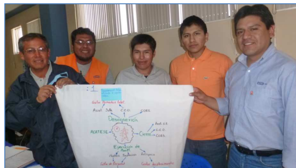
Foto5: mentes brillantes en Departamento de Transmisión sur

Asimismo, con la línea base de la evaluación de las competencias se identificaron las brechas, y se definieron planes de desarrollo de competencias transversales por cada uno de los gestores de mejoramiento. Estos planes de desarrollo van a contribuir que el rol de gestor de mejoramiento sea cada vez más efectivo. (Tabla 1)