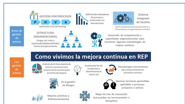
gráfico 1: Como REP vive la mejora continua

Al embarcarnos rumbo a la implementación de las buenas prácticas de gestión de activos, nos abrió la mente para implementar otros sistemas de trabajo como: evaluar el desempeño de los activos, analizar los incidentes identificando la causa raíz, gestionar los riesgos, generar lecciones aprendidas aplicables a procesos, proyectos y activos, realizar prácticas de referenciamiento y aprender nuevas metodologías y herramientas para mejoramiento de procesos y activos. (Ver gráfico 1)