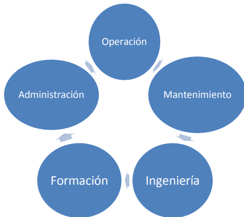
Ilustración 1 Estructura mantenimiento OMETA

La principal función del mantenimiento es garantizar la disponibilidad de los equipos en todo momento para no afectar la prestación del servicio o la producción de un bien. Partiendo de esta premisa el plan de mantenimiento de una organización debe involucrar a todo el personal de la organización, esto incluye al gerente y demás personal administrativo.