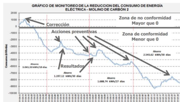
Ilustración 2 Ejemplo de Seguimiento de control operacional

El sexto paso es comunicar internamente a todo el personal de la organización los resultados obtenidos, basados en los indicadores y en los ahorros obtenidos