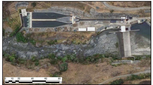
Figura 2. Boca toma Tulua Alto