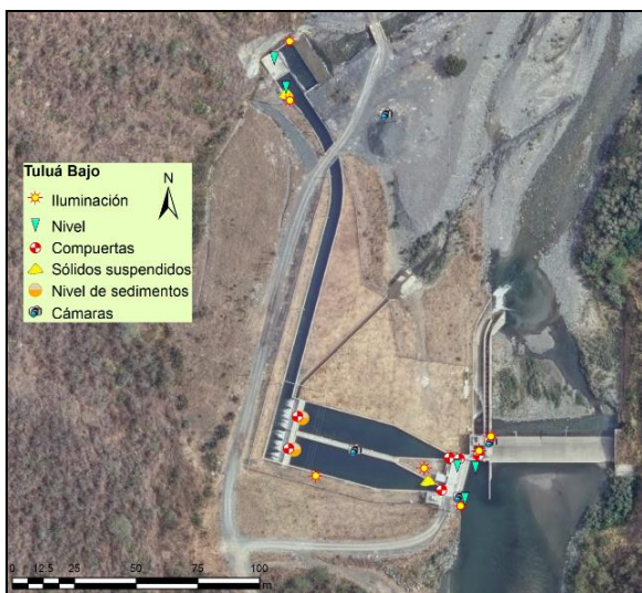
Figura 8. Intervención Boca toma Tulua Bajo

En la Tabla 1 se presenta parte de los beneficios y riesgos socio ambiental identificado para la iniciativa, así como también las acciones propuestas que permiten fortalecer los beneficios del proyecto y mitigar los riesgos identificados. Se identifica como un punto clave la comunicación asertiva con los equipos humanos, en búsqueda de disolver cualquier duda referente al objetivo real de este tipo de intervenciones en la cual se busca reducir los riesgos locativos a los que se ven expuestas las personas, mejorando sus condiciones de trabajos.