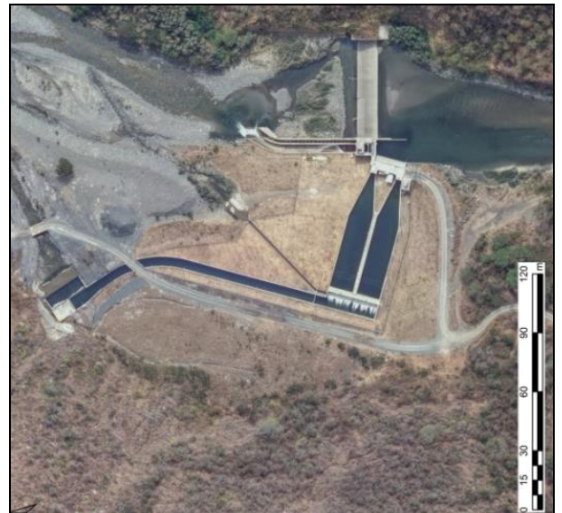
Figura 3. Boca toma Tulua Bajo

De acuerdo con la validación de los sitios y sistemas a intervenir, en la Figura 4 se presenta los principales sistemas a intervenir.