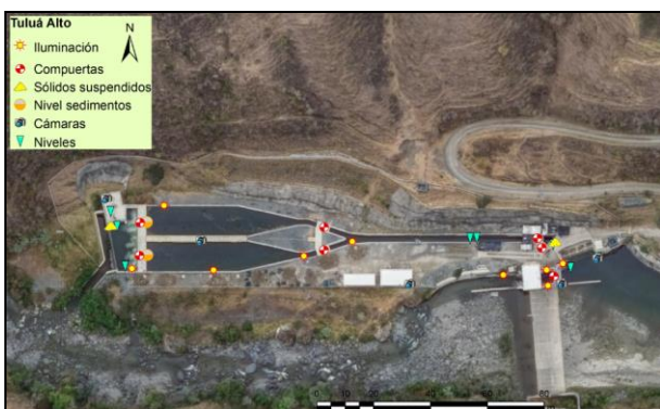
Figura 7. Intervención Boca toma Tulua Alto