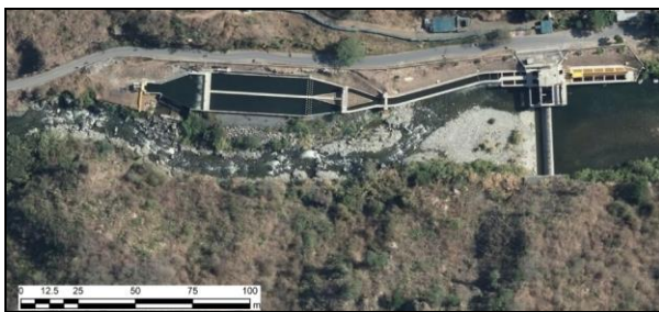
Figura 1. Boca toma Amaime

Como caso de estudio se presenta la aplicación de la metodología descrita anteriormente en las bocatmas de algunas centrales hidroeléctricas menores de 20 MW. En la Figura 1, Figura 2 y Figura 3 se evidencian la disposición de las bocatmas desde una fotografía aérea.