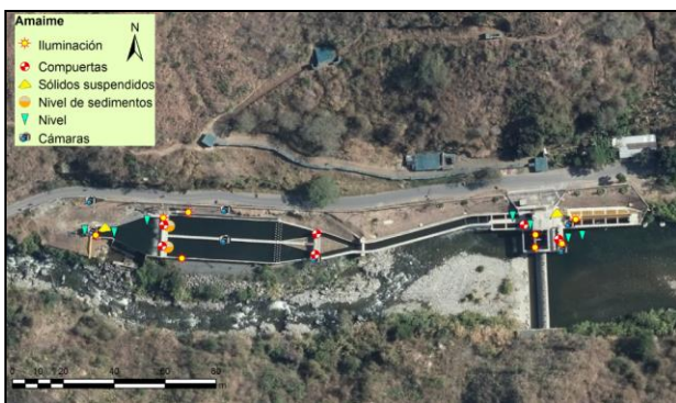
Figura 6. Intervención Boca toma Amaime

Como parte del proceso de intervención en ejecución, en las siguientes figuras se ilustra parte de los equipos y sistemas planteados para la ejecución de la iniciativa.