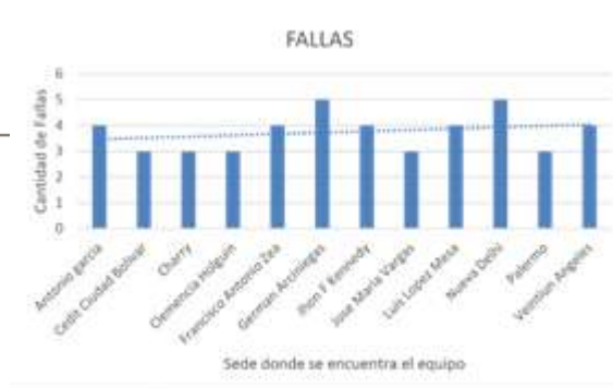
Fig. 3 Fallas en procesadores de alimentos

Otros resultados realizados en una empresa de servicios: está conformada por equipos utilizados para comedores industriales. (Ver figura 3)